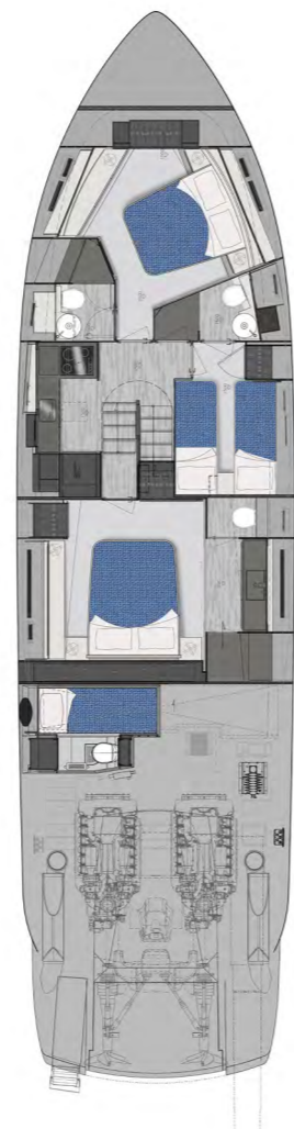
Lower Deck | 3 cabins std layout