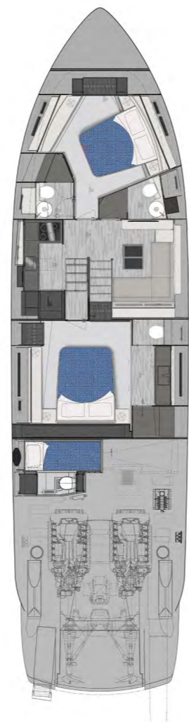
Lower Deck | 2 cabins opt layout