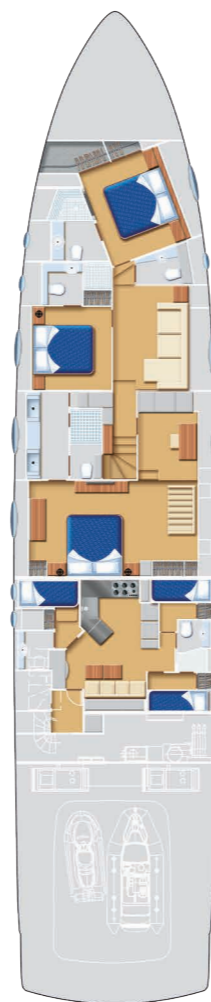
Lower Deck | 3 cabins with lower dinette layout (opt)